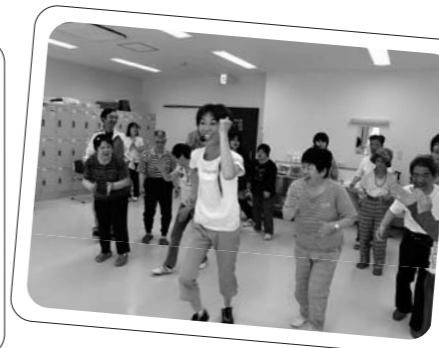
生活介護(エアロビ)