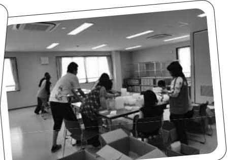
就労継続B作業風景